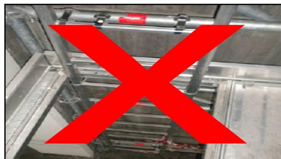
Nicht zulässig: Transport über Steigleiter