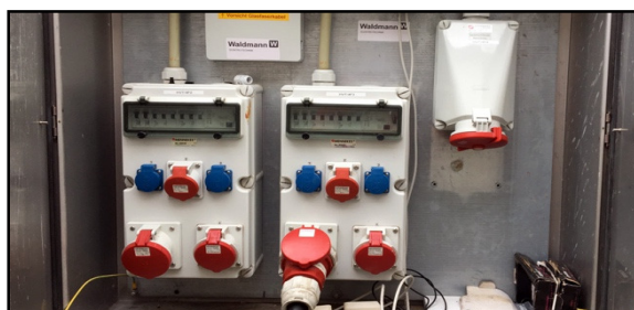
Beispiel Stromanschluss Ü-Wagen Stellplatz