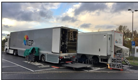
Abbildung Beispiel Ü-Wagen Stellplatz

Für den Fall, dass die benötigten Stellflächen oder Zufahrten am Produktionstag bzw. bei Eintreffen der Übertragungstechnik belegt oder nicht benutzbar sind, hat der Heimverein gegebenenfalls entstehende Mehrkosten (z.B. Abschleppkosten bis hin zum kompletten Produktionsausfall) zu tragen. Dies gilt auch für die benötigten Arbeitsflächen und Arbeitswege im Innenbereich, insbesondere bei kurzfristigen Umbauarbeiten über Nacht.