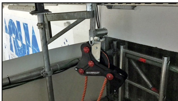
Seilzug bauseits vorhanden

Bei allen Kamerapositionen muss unbedingt beachtet werden, dass keine Zuschauer, Gegenstände oder bauliche Hindernisse den freien Blick auf das gesamte Spielfeld verdecken. Insbesondere bei Kamerapositionen im öffentlichen Zuschauerrang ist darauf zu achten, dass auch stehende Zuschauer mit erhobenen Händen die Spielfläche nicht verdecken. Gegebenenfalls ist der Bereich vor der Kameraposition zu sperren und die Zahl der Zuschauer in diesem Bereich zu reduzieren. Dies betrifft auch das Zusammenspiel zwischen den Arbeitsbereichen des Host Broadcasters und der Fotografen am Spielfeldrand. Für Nutzung und Einrichtung aller Positionen sind vom Heimverein bauseits die entsprechenden Voraussetzungen zu schaffen.